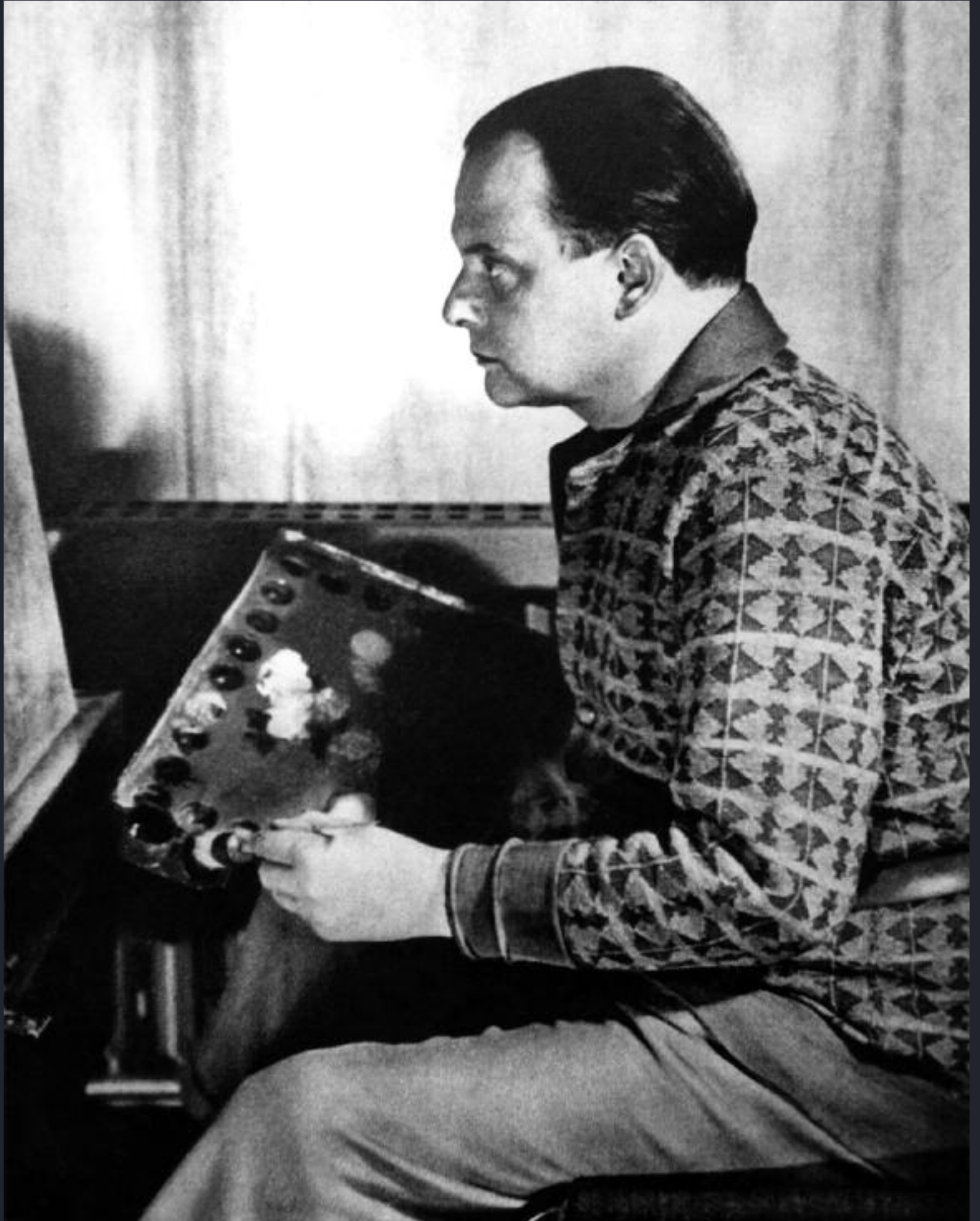
Portrait de Paul Klee (vers 1925) Photographie anonyme Crédit photo © Interfoto / LA COLLECTION