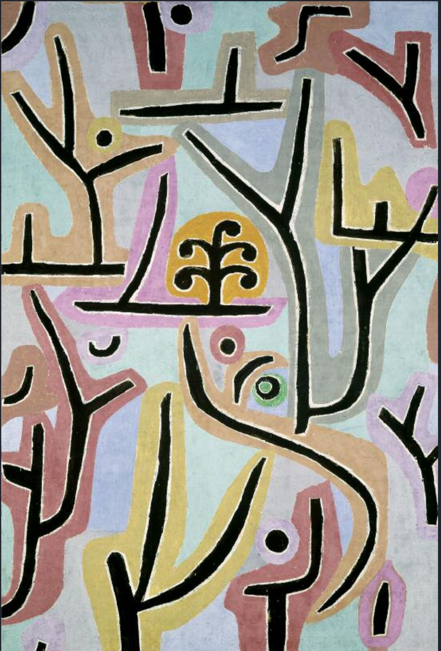
Parc près de Lucerne (1938) Paul Klee